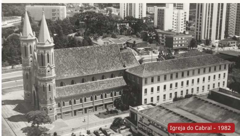
Igreja do Cabral - 1982

Sob o olhar misericordioso do Senhor Bom Jesus, sigamos adiante, com o coração cheio de fé e esperança, certos de que esta história - a nossa história - continua sendo escrita todos os dias.