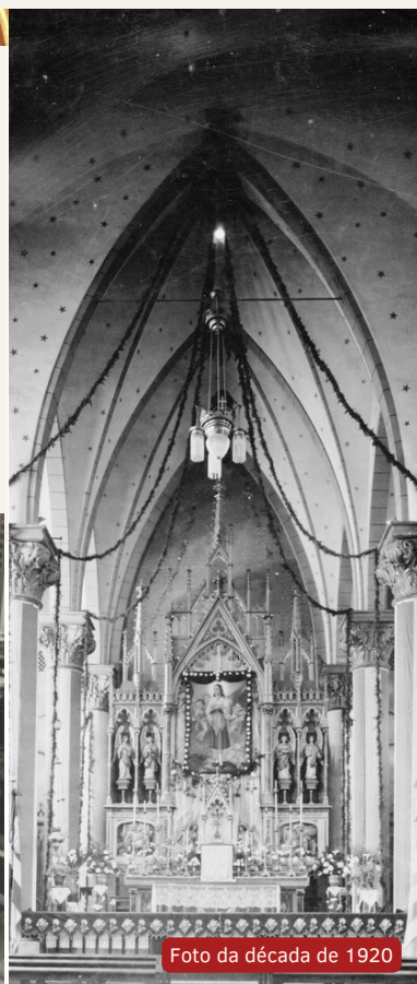
Foto da década de 1920