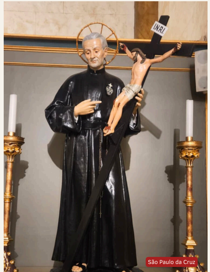
São Paulo da Cruz

Eterna gratidão da comunidade aos párocos que se dedicaram, com fé e generosidade, à construção da nossa bela e querida Paróquia Senhor Bom Jesus do Cabral. Reconhecida por todos como uma luz espiritual esplendorosa de Curitiba, está solidamente alicerçada na doação e trabalho incansável dos Párocos Passionistas.