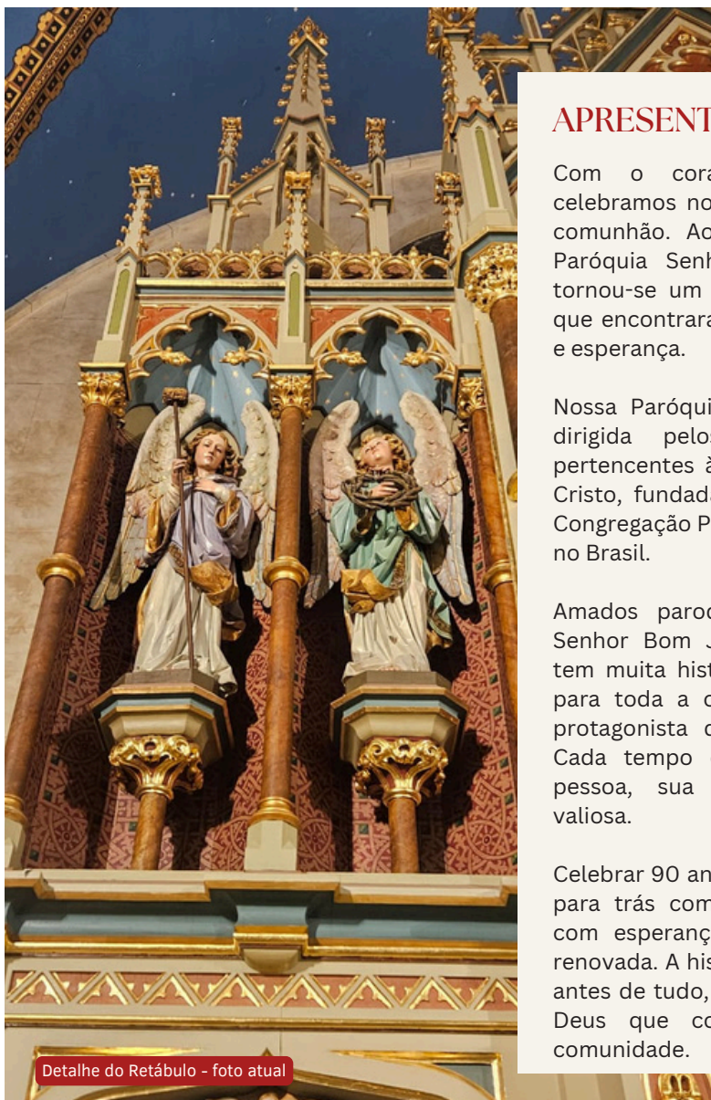
Detalhe do Retábulo - foto atual