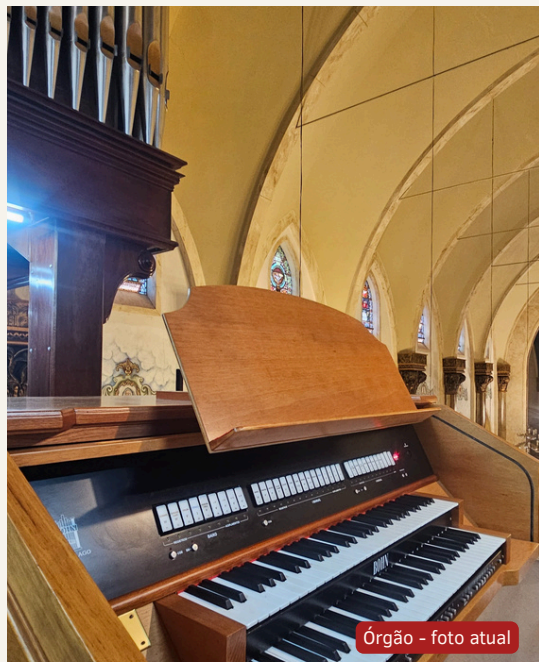
Órgão - foto atual

Dirigível Zeppelin sobrevoando a Igreja Senhor Bom Jesus do Cabral - 02/12/1936