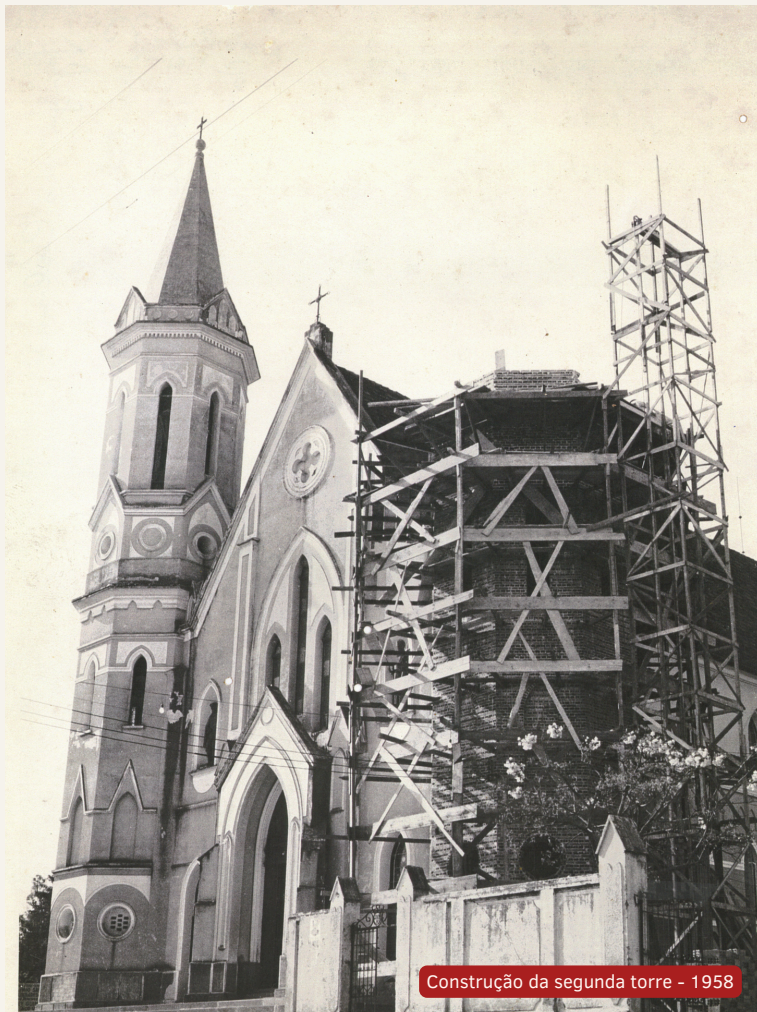
Construção da segunda torre - 1958

No dia 2 de setembro de 1976, uma explosão de um caminhão com dinamite, próxima à igreja, causou graves danos à casa e a igreja. Os vitrais da lateral esquerda foram danificados. Mas, como em tantas outras ocasiões, a comunidade apoiou a reconstrução, porque nenhuma força é maior do que o amor de um povo que crê.